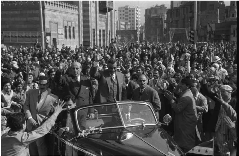
(١) الجنرال ماتى بيلد، حاكم قطاع غزة في الفترة من أكتوبر ١٩٥٦ - مارس ١٩٥٧.