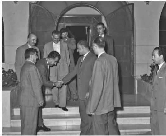
استقبال وفد الزعماء الأكراد العراقيين ١٠/٤/١٩٥٨