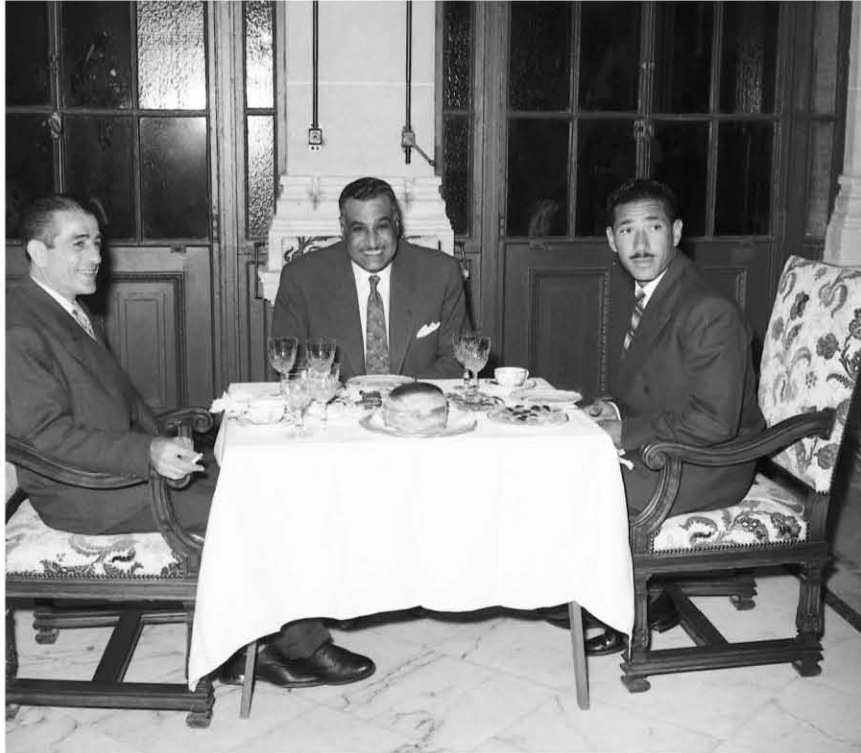
الرئيس جمال عبد الناصر يجتمع بعبد الحكيم عامر وأكرم الحوراني ١٩٥٨/٥/٢٤