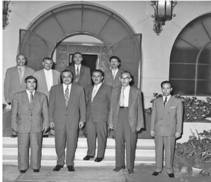
استقبال وفد الزعماء الأكراد العراقيين ١٠/٤/١٩٥٨